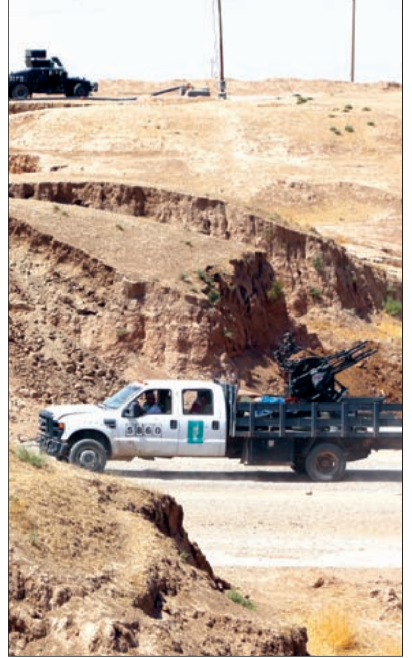
قوات الجيش العراقي تفك الحصار عن بلدة أمرلي التركمانية شمال بغداد

منذ ذلك الحين ولد الشعور بالغبن، وولدت معه فكرة إسقاط حدود أوطان اتفاقية «سايكس بيكو»، وبدأ حلم «الخلافة» يراود من جديد كل من تخرج من مدارس «طالبان» الممولة «وهايباً»، وكان «الإخوان المسلمون» البادئون بتسويق هذا الفكر منذ سقوط الخلافة العثمانية، وهذا المزيج «المتطرف» بين فكر «محمد بن عبد الوهاب» في منتصف القرن التاسع عشر وفكر حسن البنا عام 1928 مستمر في كافة مدارس «الإسلام السياسي» المعاصر، إلى حين ثبوت عدم جدواه للمضللين من أهل السنة في العراق،