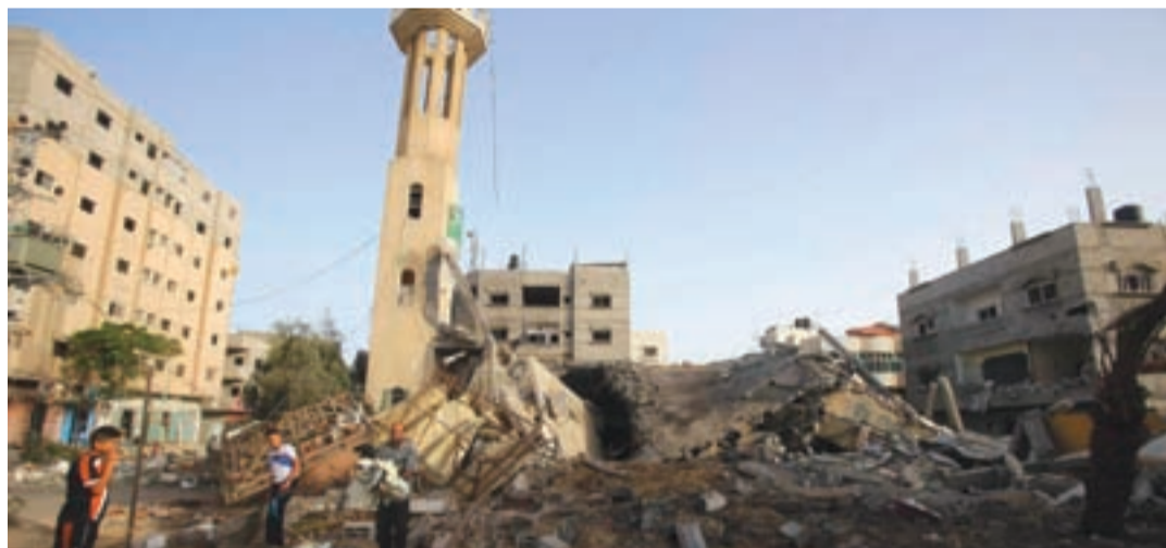
آثار الدمار الذي ألحقه العدوان الصهيوني الأخير على غزة

عكس العدوان الصهيوني على قطاع غزة مدى عجز وتفهم المجتمع الدولي تجاه همجية واجرام الاحتلال، خصوصاً بعد صمته على قتل أكثر من ألفي مدني فلسطيني معظمهم من المدنيين وثلثهم من الأطفال، كذلك تدمير عشرات آلاف البيوت وضرب البنى التحتية وتشريد نحو ثمانين ألف فلسطيني من منازلهم، خصوصاً بعد ان اكدت السلطة الفلسطينية ان تكلفة إعادة اعمار قطاع غزة تقارب الـ 8 مليارات دولار امريكي. فظاعة العدوان وهمجيته والتواطؤ الغربي والعربي وصمت المجتمع الدولي من جهة وصمود المقاومة والوحدة الفلسطينية من جهة اخرى، يطرح العديد من التحديات اليوم وبرزها الحفاظ على الوحدة الوطنية الفلسطينية وتكريسها من خلال وضع خطة عمل فلسطينية شاملة تعمل على مختلف المستويات السياسية والاقتصادية والاجتماعية والقانونية والتنموية، ومن خلال العمل على