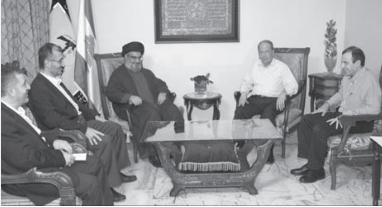
لقاء السيد نصرالله - عون.. تطابق في وجهات النظر

أي بمعنى أنه لا حاجة للنقاش في تفاصيل هذه المبادرة التي سبق للعماد عون أن رفضها.