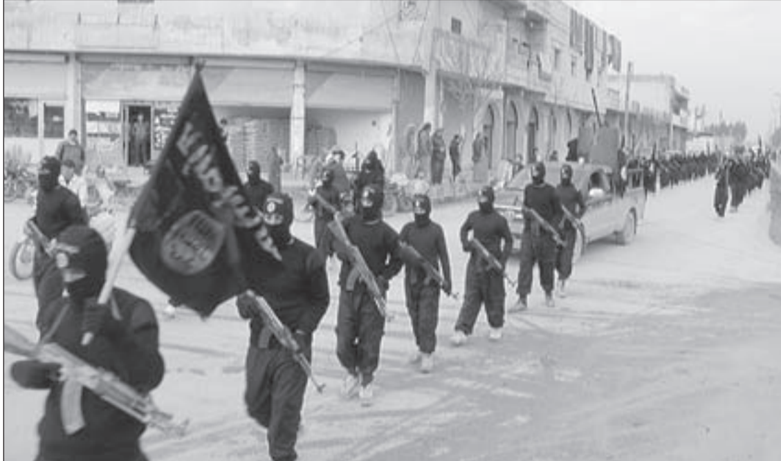
«داعش» مقبولة أميركياً في سورية وإرهابية في العراق