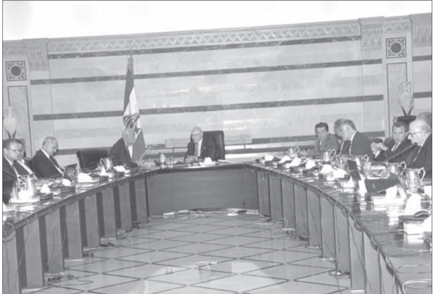
مجلس الوزراء.. هل أدرك ماذا فعل؟