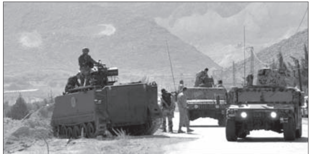
آليات للجيش اللبناني على مشارف منطقة عرسال

يمنع إقبال معبر عرسال لإمداد المسلحين لتمكينهم من ذبح العسكريين والإعتداء على بعض أهالي عرسال الوطنيين وخطفهم وإعدامهم... يمنع إقبال الحدود حتى الرسمية أمام الإرهابيين القادمين بصفة نازح!!