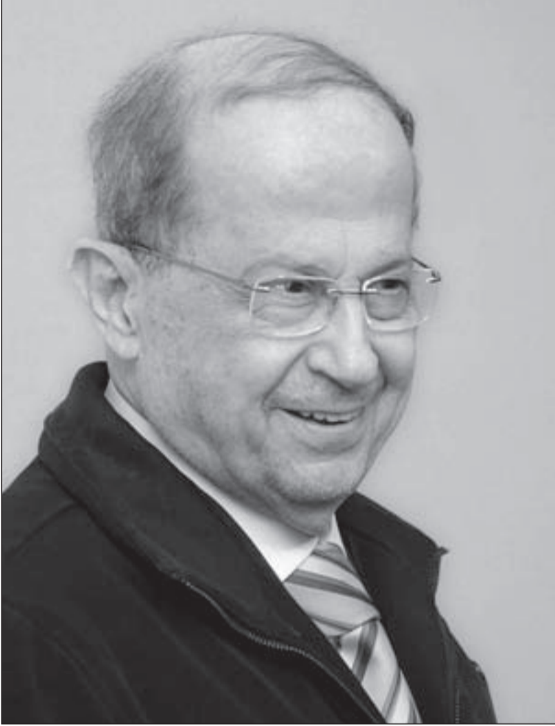
هل يعيد العماد ميشال عون النظر في «مأسسة» التيار؟

قبل الدخول إلى أقلام اقتراع جبل لبنان، لا بد من التوقف عند انكفاء التيار الوطني الحر عن المشاركة بمعركة مدينة جبيل نتيجة سقوط التوافق، فهذا الانكفاء ليس انسحاباً تكتيكياً بقدر ما هو خطأ استراتيجي غير مقصود، يتحمل نواب «التيار» الثلاثة في جبيل مسؤوليته، نتيجة عجزهم عن أن يكون لـ «التيار» وجود ضمن الحد الأدنى في لائحة حواط، وهم المدركون أن إنجازات حواط الرائدة للمدينة، جعلت منه «تياراً» قائماً بذاته، نتيجة عجز هؤلاء النواب - رغم صدق نواياهم واندفاعهم - عن تحقيق مشاريع بارزة لجبيل، تقارب جزئياً إنجازات حواط، لأنهم عانوا من الظلم؛ أسوة بزملائهم في كسروان والمتن وبعيدا، من تجميد حركتهم كنواب وأيضاً كوزراء، نتيجة حقد «الحريرية السياسية» على كل «نواب ووزراء ميشال عون». ومن معركة زحلة والبقاع الغربي، إلى معارك كسروان وجبيل وبعيدا والشوف، خاض ميشال عون معاركه بالعونيين، وبدا «التيار» كتنظيم سياسي وماكينات انتخابية بحاجة إلى إعادة هيكلة، لا بل إلى «تغيير وإصلاح»، والمشكلة ليست في رئيس «التيار» جبران باسيل، بقدر ما هي بتزكية باسيل دون انتخابات، ما ولد شرخاً بين العونيين و«التيار»، خصوصاً أن أنصار «العونية» كتيار شعبي لم يرحبوا كثيراً بالتيار النظامي، وما تولده الهيكليات السياسية والإدارية من شروخ بين القاعدة والهرم. زيارة العماد عون إلى مقر لائحة «كرامة جونبة»، هي نزول إلى ساحة الدفاع عن الكرامة، بعد أن فتحت النار على الجنرال برصاص لا يستهدف جوان حبيش أو كرسي بلدية جونبة، بقدر ما تستهدف كرسي بعيدا عبر جونبة، وهذه الزيارة وإن كانت بالمبدأ غير مستحبة لزعيم وطني كبير أن ينزل إلى «ساحة البلدية»، لكن الجنرال لم يكن