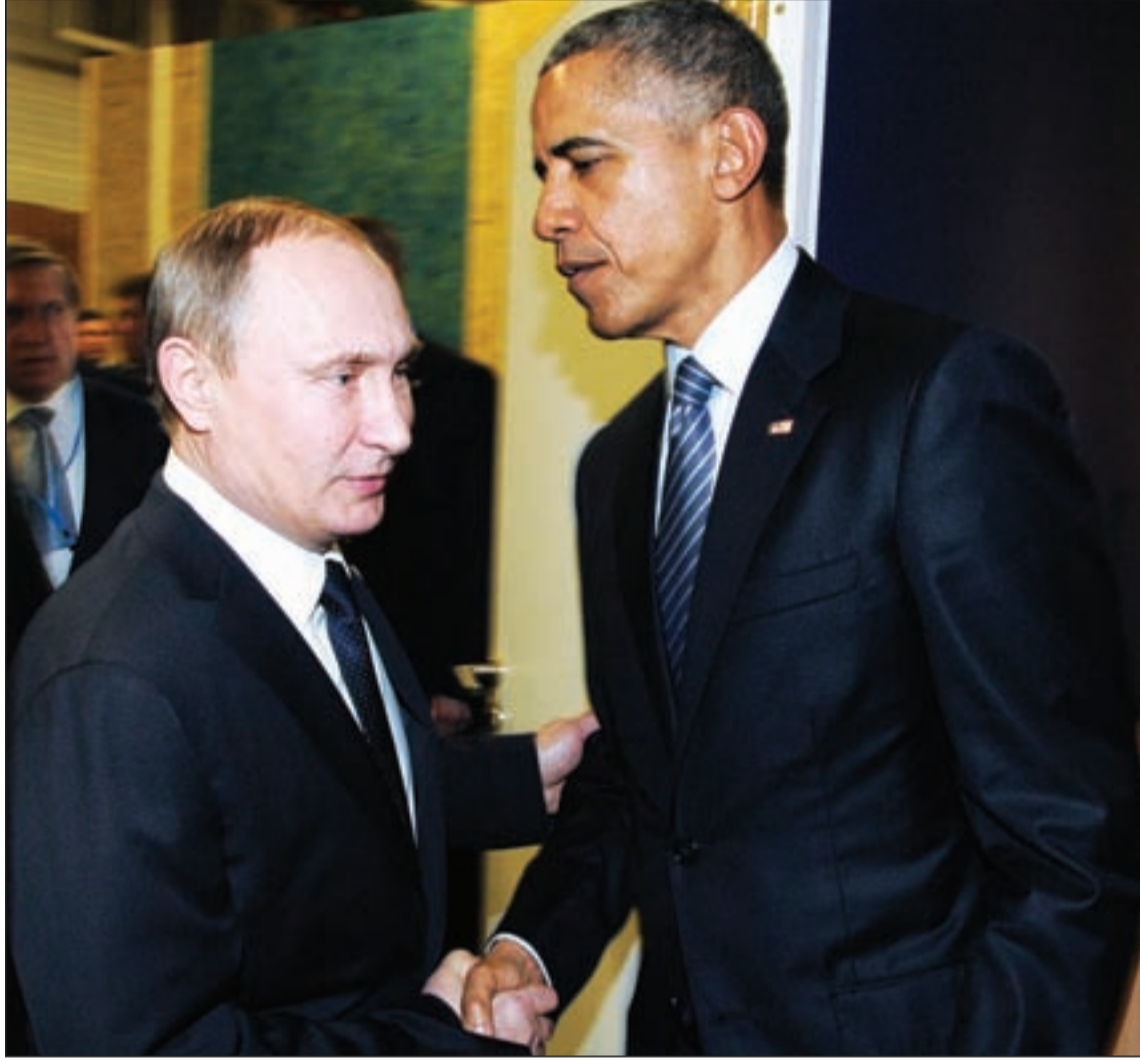
الإدارة الأميركية تناور قبل أن تدخل في حالة الشلل بعد شهر آب

وتسوية الأزمة الأوكرانية، بالتوازي مع حملة دعائية مضللة بأن روسيا هي المعرقل، بينما الموقف الروسي واضح لجهة اتهام كييف بتغيير الموقف في المفاوضات، للتخلص من اتفاق