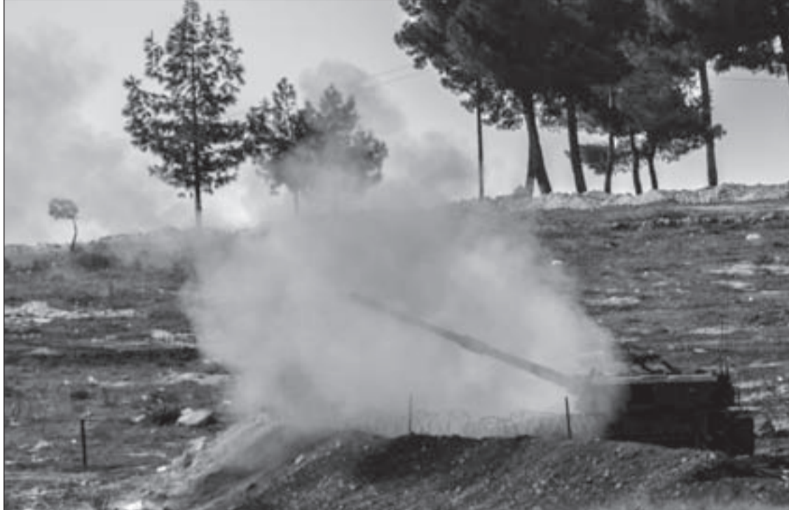
مدفعية الجيش السوري تستهدف أوكار المسلحين في تل العبر بريف حلب

الوطنية السورية، وبالتعاون مع موسكو، نزعوا هذه الذريعة من يد واشنطن، وأجهضوا حلم حلفائها في المنطقة، من أمثال قطر والسعودية وتركيا، وطبعاً في مقدمهم تل أبيب، بالتدخل الأميركي، وتدمير سورية.