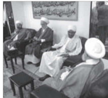
الشيخ ماهر حمود مستقبلاً الصادق المهدي في مكتبه

في مشروع جهادي مقاوم يمتد من فلسطين إلى لبنان وبلاد الشام والسودان، وسائر البلدان، كون القضية الفلسطينية هي قضية أمة وليست قضية شعب أو قضية حزب، وجميع البنادق يجب أن توجه صوب العدو المتريص والرابض على أرض فلسطين، وما سوى ذلك هو حروب عبثية لا تجر سوى الولايات على شعوب وبلاد المسلمين.