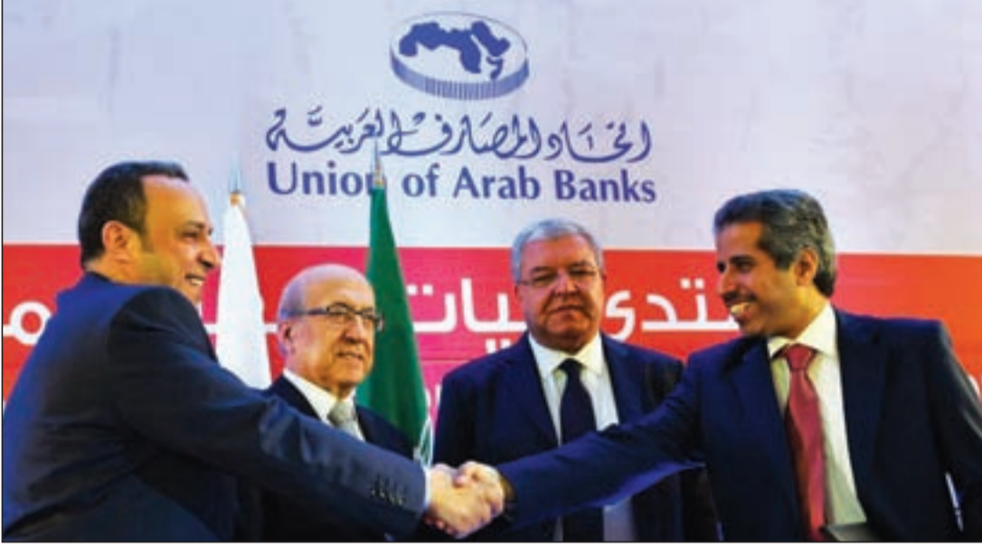
محاصرة المصارف اقتصادياً سيرتد سلباً على الجميع.. دون استثناء

(السنة) والفلوجة والرمادي، وتهدم المساجد السنوية، وتقتل علماءها، وتغتصب نساءها، وكلهم من أهل السنة.. فكيف تكون الحرب مذهبية؟ الساكت عن الحق شيطان أخرس، والحرب مفصلية في هذه الأيام، ولا مكان للحبيديين فيها، فإما أن تنصر الحق ولا تخذله، أو تسكت عن الباطل الذي يجتاح دولنا ويدمر بيوتنا ويقتل أهلنا.