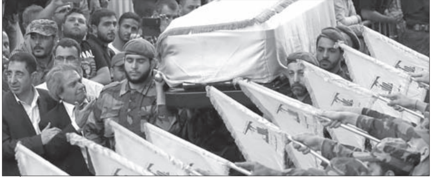
من مراسم تشييع القائد الجهادي الشهيد مصطفى بدر الدين

وكان المقصود تصفية سليمان نفسه، الذي لم يكن موجوداً حينها في سورية. وربط بالأمر، لفتت المصادر إلى أن مشاورات حثيثة تجري بين طهران وموسكو، التي نقلت رسالة إيرانية «من العيار الثقيل» إلى واشنطن، مفادها «وصلت الرسالة. وردنا لن يقف عند هذا الحد».